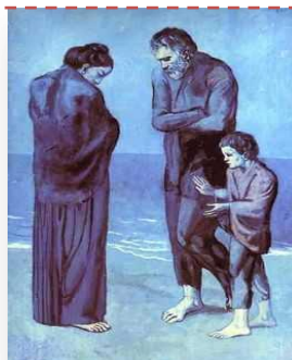
La tragédie, 1903