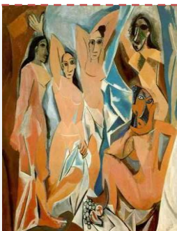
Les demoiselles d'Avignon, 1907