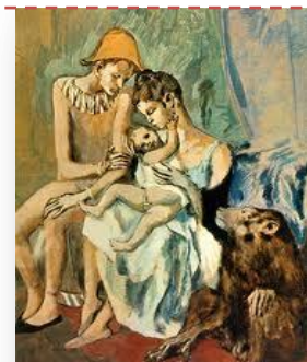
Famille d'acrobates, 1905