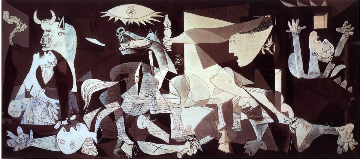
Guernica, Pablo Picasso, 1937, 3.5mx7.8m. Museo Reina Sofia, Madrid